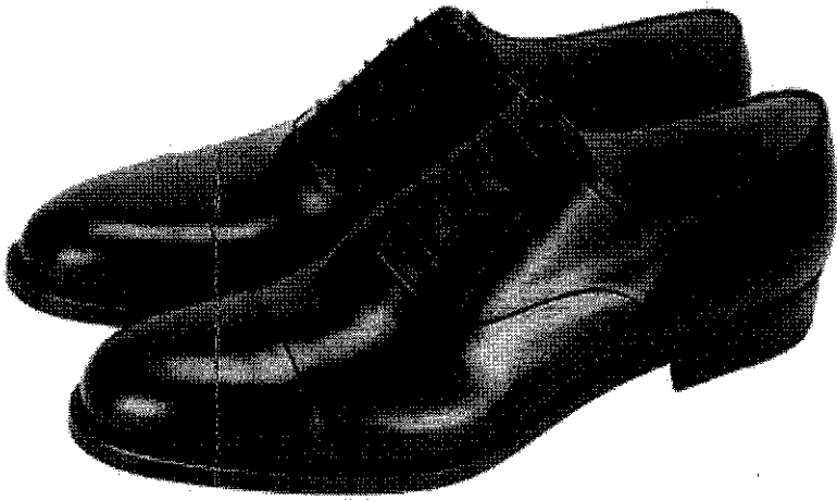
黑色素面皮鞋(男生)